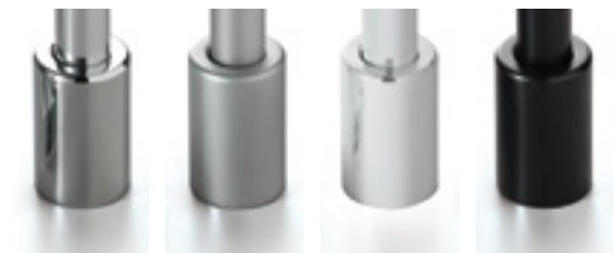
29 Cedit- Chrom