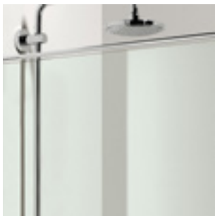
H1 ESG transparent