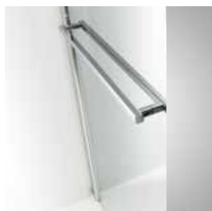
Handtuchhalter im Glas für Trennwände