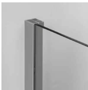
VARIO 15 mm Verstellbereich