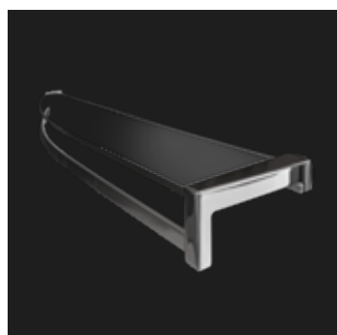
Glasablage für Trennwände