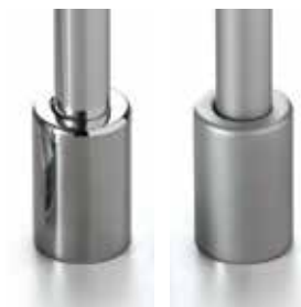
29 Zenit- Chrom