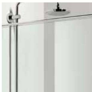
H1 ESG transparent