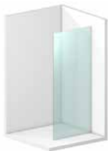
Trennwand mit Wandanschluss